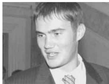
Віктор Янукович - молодший.

На заклик "Майдану" до Верховної Ради прийшли кількасот людей. Зібрались дуже різні люди, в основному без партійної та організаційної символіки - як ми і просили, з національними кольорами. Спочатку ми зібрались в Маріїнському парку поруч з пам'ятником Ватутіну. Роздавали жовто-сині стрічки та листівки. "Блакитні" прихильники "народного" прем'єра Януковича заблокували весь периметр вздовж огорожі, що веде до входу у ВР. Однак о 10.30 наша група (самі активні), кількістю близько 100 чол. пройшла до входу до огороженої території та зробила коридор, довжиною в 30 метрів. З обох боків були зв'язані синьо-жовті стрічки та декілька гасел проти нової коаліції і з вимогами найкоротшого розблокування Конституційного Суду. Коридор став єдиним шляхом для депутатів до ВР через головний вхід (щоправда, туди по-щурячому можна забігти через численні додаткові ходи). Коридор ми підтримували до 12.30, аж поки не почали виходити депутати. Дружнім свистом і криками "ганьба" зустріли проходження Януковича-молодшого.