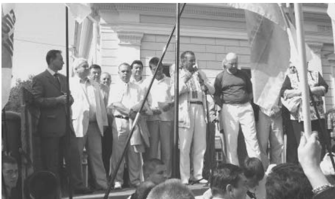
Депутати від БЮТ виступають на мітингу біля Верховної Ради.

Під Верховною Радою відбувається акція противників КРС. Близько 1 000 людей (в основному з прапорами Блоку Юлії Тимошенко) заблокували вулицю Грушевського навпроти Верховної Ради. Вздовж периметру огорожі ВР з боку Маріїнського парку, та на його території стоїть біля 5000 "регіоналів". Як і вчора, продовжує працювати машина ПР з гучномовцями. Водночас, навпроти вікон ВР розташована сцена БЮТ, з якої ведеться мітинг. Виступають депутати від БЮТ. Олександр Турчинов, виступаючи на мітингу, повідомив, що акція носить безстроковий характер і проходитиме по всій Україні до ухвалення рішення про розпуск парламенту.