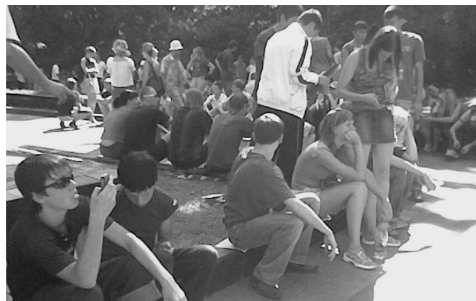
Школярі-суроти "агітують за Януковича" у Маріїнському парку.

У деяких відвідувачів майданівського Вільного Форуму ця інформація викликала сумніви і вони зажадали від нас підтвердження у вигляді фото. Ось воно.