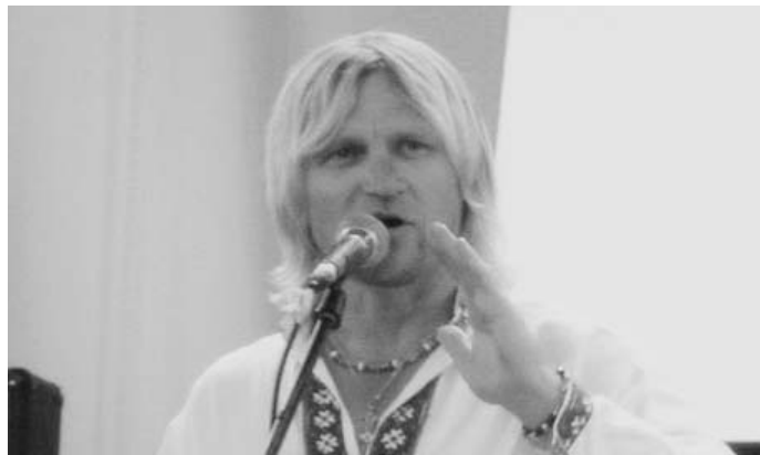
Олег Скрипка. Фото з фестивалю "Країна мрій"

На "Майдані" з'являється залик "ТРЕБА ВСТАТИ І ВІЙТИ!" до всіх, для кого "Вільна Україна - святі слова; хто має за справу честі боротьбу за правду, свободу, справедливість, власну гідність". Акція призначена біля Верховної Ради на вівторок, 11.07.06. "Ми не "помаранчеві". Наші кольори - синій і жовтий. Пов'яжи на ознаку громадянської солідарності синьо-жовту стрічку" , - йдеться у зверненні.