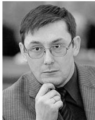
Юрій Луценко.