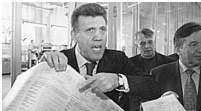
Сергій Ківалов (в народі відомий як "Підрахуй") під час "сумлінної праці" головою ЦВК у 2004 році

Під час проведення пресвітницької акції "Схід та Захід разом проти криміналу" під гаслом "Ні бандитському реваншу" на активістів Рівненського обласного осередку ВГО "Антикримінальний вибір" напали