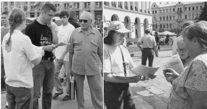
Активісти роздають газету на Майдані Незалежності.

Шалений попит громадян на правдиву та непартійну інформацію про останні політичні події в країні, який щоденно спостерігають всі, хто приходить на київський Майдан Незалежності до нашого інформаційного намету, змусив майданівців здійснити реальний подвиг. В фантастичні терміни та в умовах хронічної нестачі ресурсів сьогодні вийшов друком накладом 5000 примірників перший номер газети "Територія Правди" - друкованого видання Альянсу "Майдан". Газета зареєстрована офіційно і розповсюджується безкоштовно. Видання стало можливим виключно завдяки фінансовій допомозі читачів Майдану.