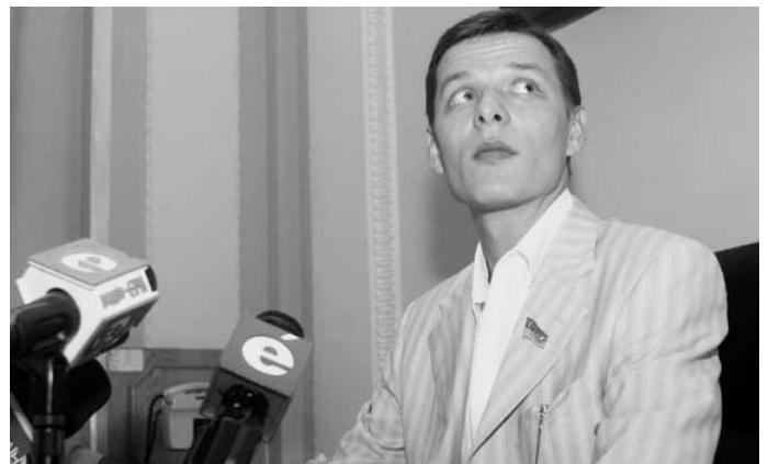
Олег Ляшко дає прес-конференцію.

Парадокс ситуації полягає в тому, що шість років тому Мороз уже був учасником "касетного скандалу". Тільки коли він оприлюднив записи Мельниченка, він здавався героєм. Тоді весь світ жахнувся від фактів корупції у вищих ешелонах влади, про режим Кучми та правду про зникнення журналіста Георгія Гонгадзе. Варто зазначити, що в оприлюднених літературних записках фігурували прізвища багатьох його сьогоднішніх соратників, з якими він підписав угоду про створення коаліції.