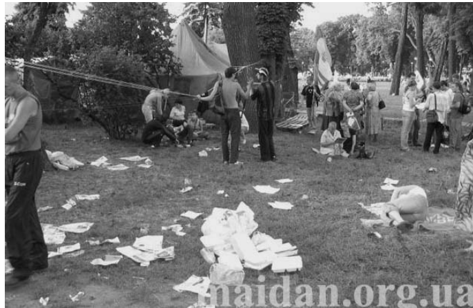
Табір "регіоналів" в Маріїнському парку.

За добу регіонали рясно загадили Маріїнський парк сміттям. 11 липня під час першого нашого мітингу активістка Майдану, адвокат Тетяна Монтян сказала, дивлячись на "обід" регіоналів: "Це ж вони тільки починають кушати, а що буде, коли вони почнуть какати?" Чекати довго не довелося... Після показового мітингу "прихильників" Партії Регіонів та т.зв. Антикризової коаліції (більш відомі серед читачів як КРС, КПРС, СРАКА), Маріїнський парк нагадував помийку. А ще регіонали крали фотоапарати, "богоугодні" бабці з Лаври громили намети та штовхалися з міліціонерами. Загалом кожен розважався, як міг.